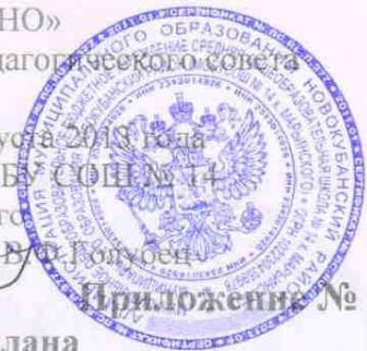
Таблица-сетка часов учебного плана